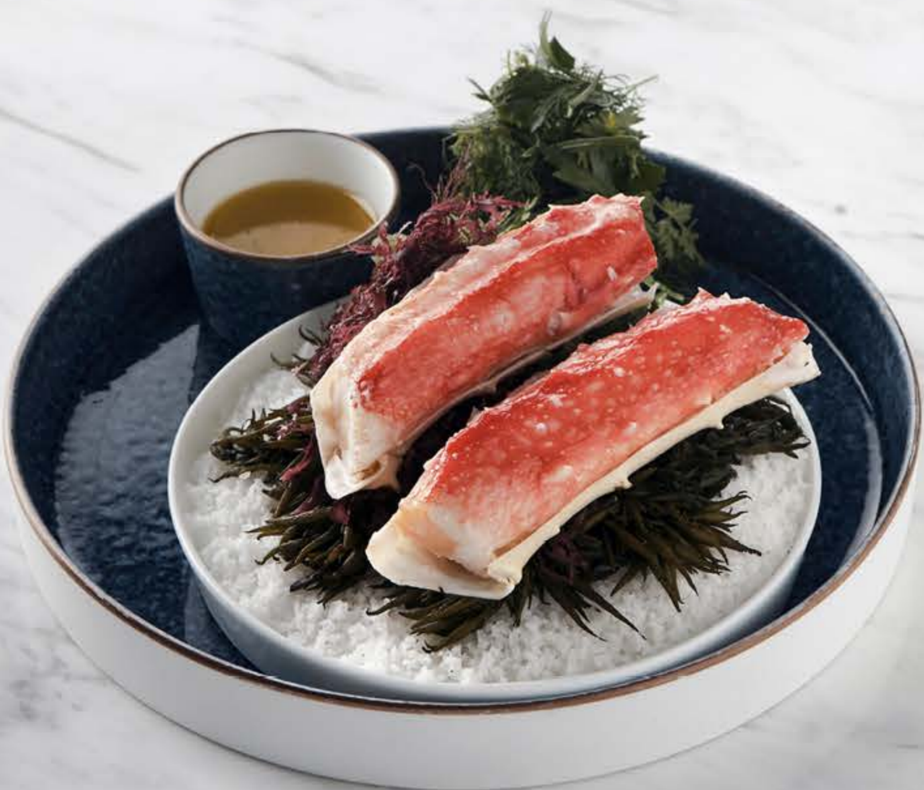
킹크랩 다리 Smoked king crab legs