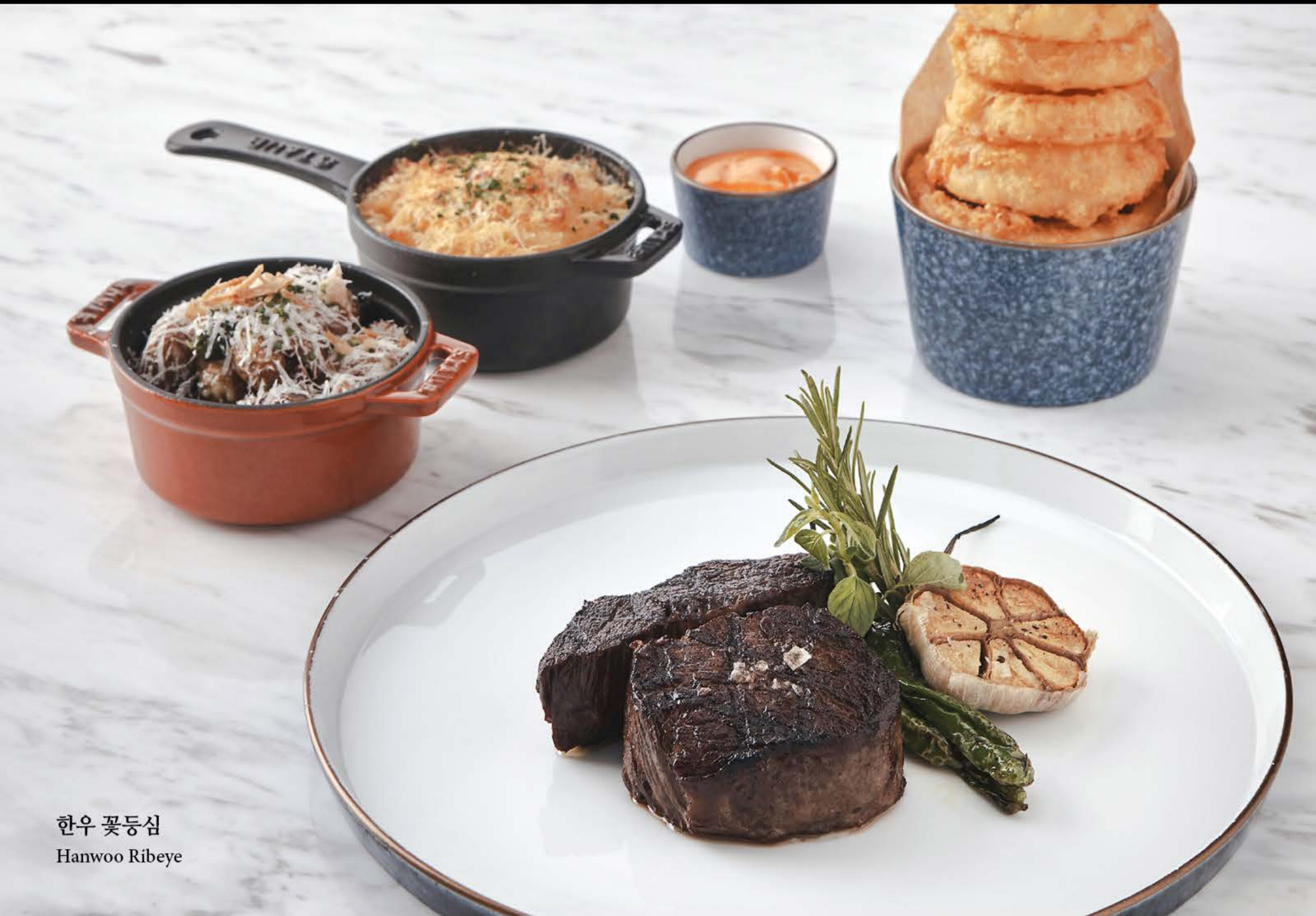
한우 꽃등심 Hanwoo Ribeye