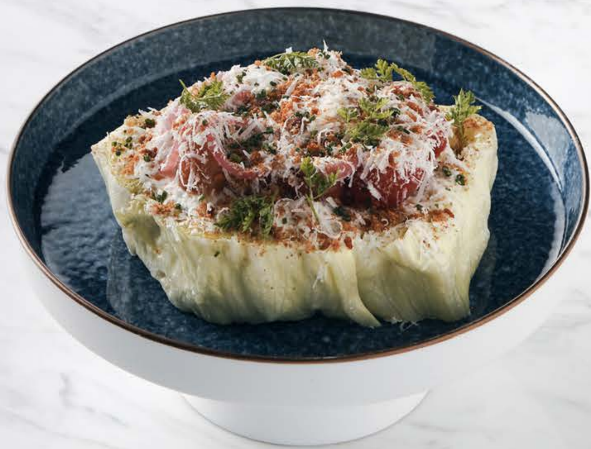
아이스버그 양상추 샐러드 Iceberg wedge salad