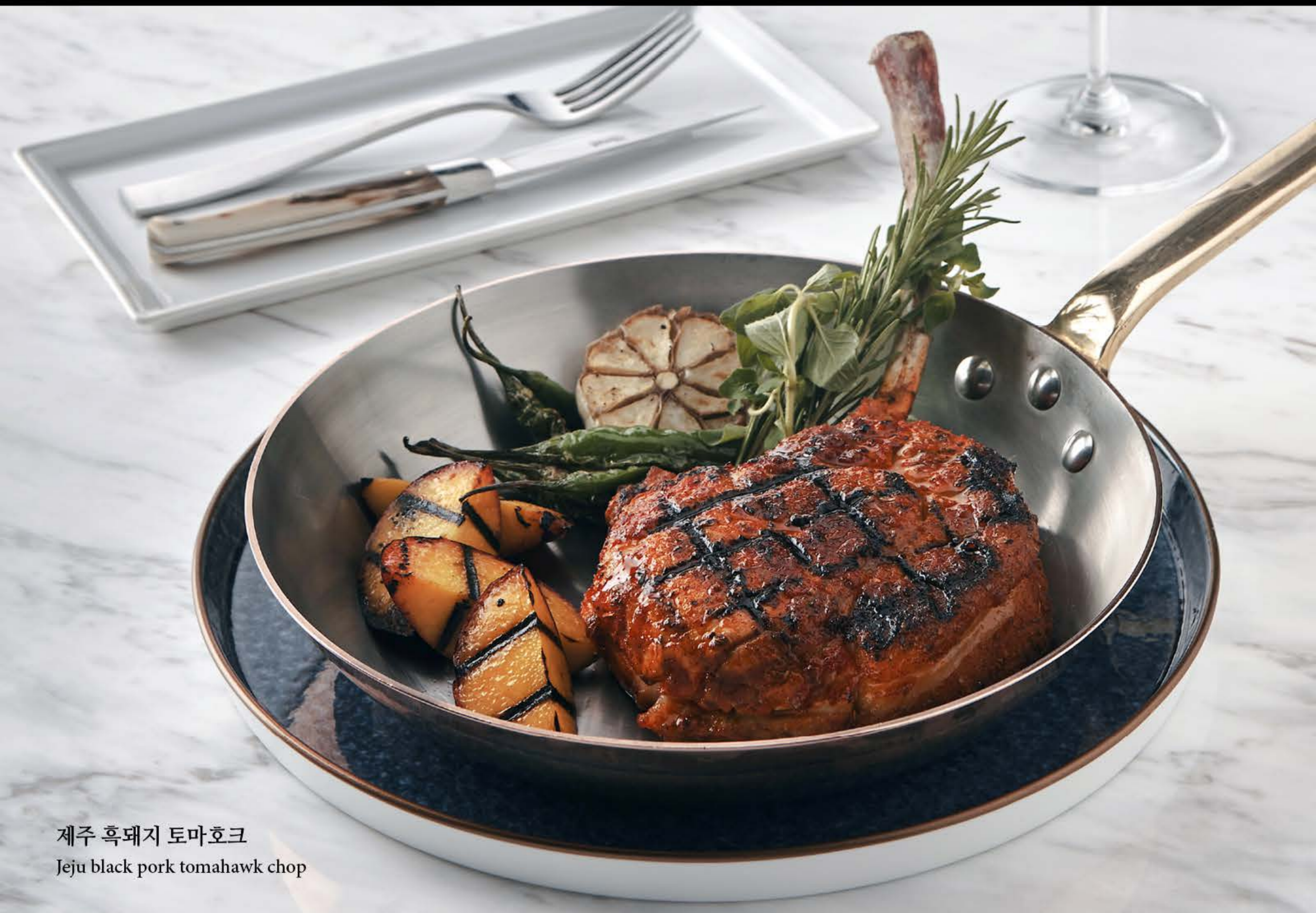
제주 흑돼지 토마호크 Jeju black pork tomahawk chop