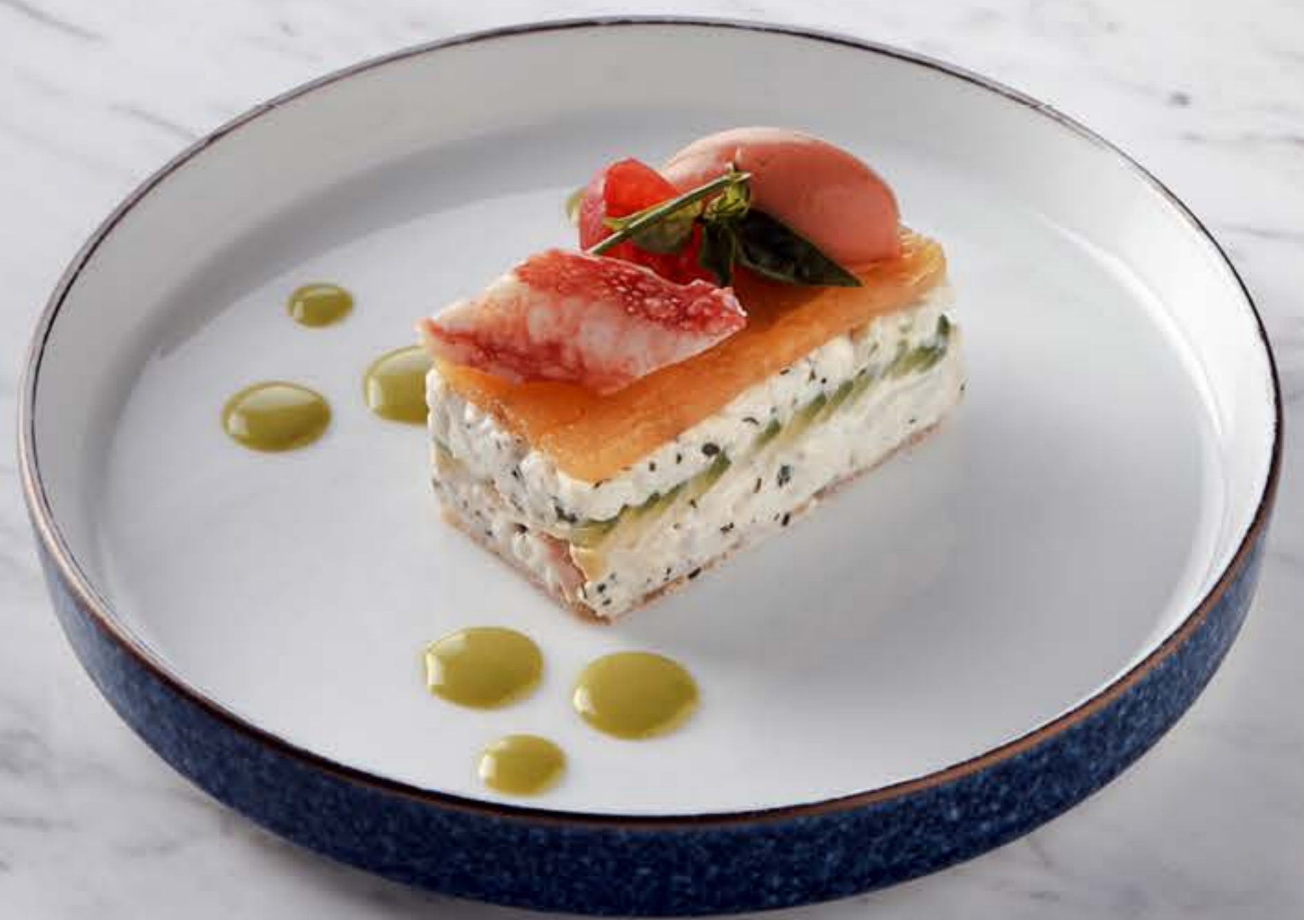
킹크랩 샐러드 King crab salad