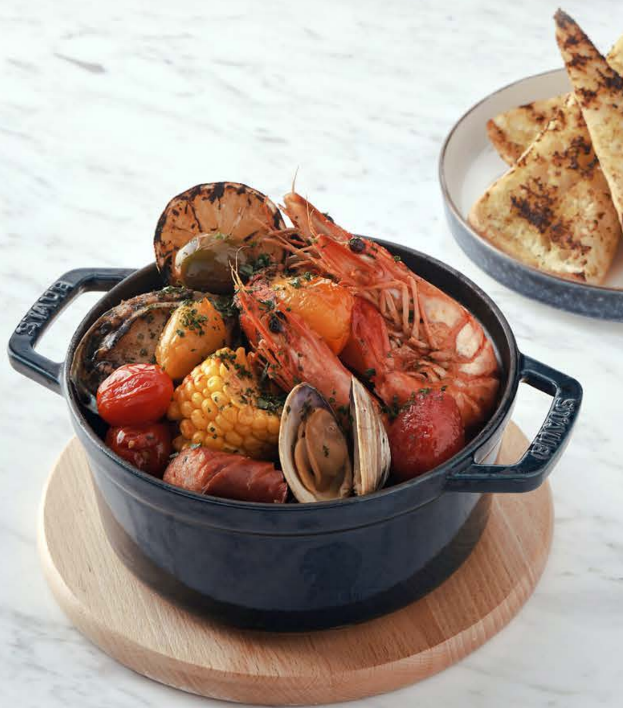
제주 씨푸드 보일 Jeju seafood boil